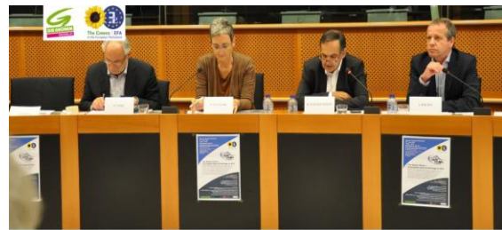
Blaues Herz in Brüssel Die Balkanflüsse erhalten gegen verheerende Abholzung. Im Rahmen der Kampagne „Jedem das Blaue Herz Europas“ werden Entwürfe und Pläne...

Gemeinsam mit der EU Abgeordneten Ulrike Lunacek (Vizepräsidentin des Europäischen Parlaments, Grüne/EFA-Fraktion.) brachten wir am 29. Juni in Brüssel nationale und internationale Interessensvertreter an einen Tisch – von NGOs über Energie-versorgungsunternehmen und Finanzinstitute bis hin zu Vertretern aus EU-Parlament und EU-Kommission. Ulrike Lunacek äußert sich besorgt gegenüber den Staudamm-Projekten entlang der Vjosa.