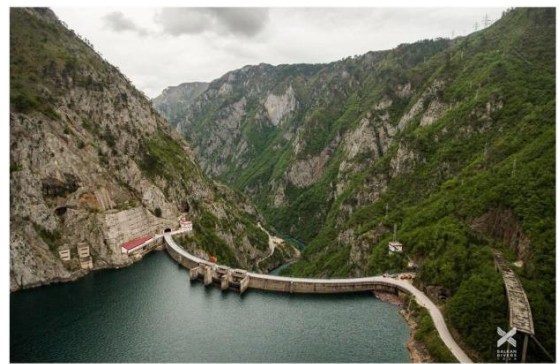
Immer mehr Staaten weltweit überdenken ihre Wasserkraft-Strategie

Ein Artikel von „ Circle of Blue “ weist auf das Ende der Wasserkraft-Ära hin. „Eine immer länger werdende Liste von Nationen aus aller Welt überdenkt große Staudämme in einer Zeit, in der Wind- und Solarenergien preiswerter, viel einfacher im Bau, weniger umweltschädlich und viel weniger durch Dürren und Hochwasser betroffen sind“, so der Bericht.