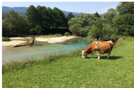
Sana in BiH. Insgesamt sind am Balkan 93 WKWs in Huchenstrecken geplant, was zu einem Rückgang dieser Art um 70% führen würden.

An der Sana in Bosnien-Herzegowina - einem der wertvollsten Huchenflüsse Europas - verweigert das Umweltministerium die Genehmigung für den Bau eines Kraftwerkes. Dieses Projekt war flussabwärts des im Bau befindlichen Kraftwerks "Medna" geplant und hätte eine wertvolle Huchenstrecke zerstört. Wir sind übrigens gerade dabei, die Flüsse in Bosnien-Herzegowina zu einem weiteren Schwerpunkt-gebiet unserer Kampagne zu machen.