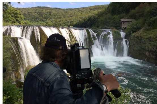
Dreharbeiten an der Una in Bosnien-Herzegowina

Anlässlich des Internationalen Tags der Flüsse zeigte das ZDF eine Doku über die Balkanflüsse und den dortigen Staudammwahn. In der Sendereihe "planet e" wird die Schönheit der Flüsse gezeigt sowie der Widerstand gegen die drohende Verbauung. Gedreht wurde am Balkan, aber auch in Wien und in Nordrhein-Westfalen. Der Film gibt einen guten Einblick in unsere Arbeit. HIER zum Nachschauen