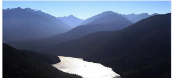
Hydropower isn't carbon neutral after all, WSU researchers say

Wasserkraft ist nicht grün, sie ist nicht einmal klimaneutral, wie die Wissenschaftler der Washington State University nun bestätigen. In ihrer Studie berichten die Forscher, dass Stauseen beachtenswerte Quellen des starken Treibhausgases Methan sind. Dieser Report ist hoffentlich ein weiterer Schritt in Richtung Ende dieser grüngewaschenen Technologie. MEHR