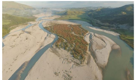
So sieht ein echter Wildfluss aus: die Vjosa in Albanien.

Medienberichterstattung im albanischen TV