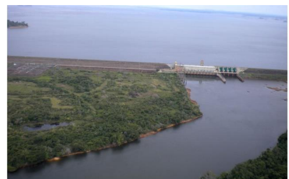
Wasserkraft ist überholt. Wann wird die Weltbank den globalen Durchbruch von Solar und Wind internalisieren?

Wasserkraft ist ein Auslaufmodell. Wind und Solar sind die Energiequellen der Gegenwart und Zukunft, denn sie sind sozial- und umweltverträglicher, sowie auch wirtschaftlich sinnvoller als Wasserkraft. Das wirft die Frage auf, warum die Weltbank diese globale Wende im Erneuerbare-Energien-Sektor zu ignorieren scheint und stattdessen nachwievor auf milliardenschwere Staudammprojekte setzt. MEHR