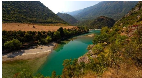
Vjosa Flusslandschaft.

Der in der Septemбераusgabe des GEO Magazin's erschienene Beitrag über die Tage der Artenvielfalt an der Vjosa ist nun auch online zu finden: Europas letzter wilder Fluss