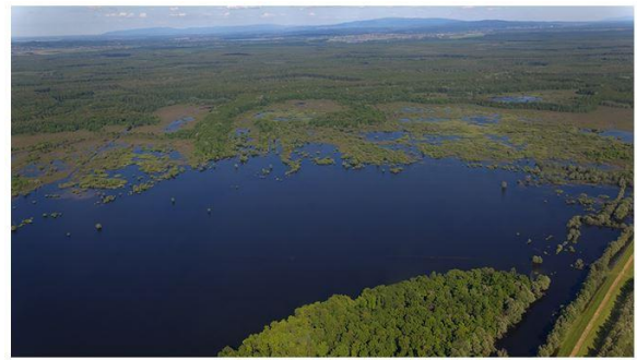
Die natürlichen Überschwemmungsflächen der Save im Lonjsko Polje Naturpark.

Mitte September ist die Save erneut über ihre Ufer getreten. Lesen Sie über die Ursachen und die daraus gezogenen Lehren in unserer Pressemitteilung . Der Standard hat das Thema aufgegriffen „ Der trügerische Schutz der Flussrinnen “