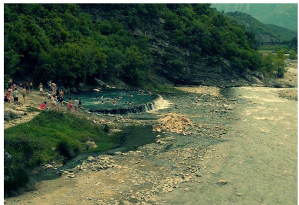
Thermalquellen an der Langarica, AL.

Die Weltbank finanziert drei Staudammprojekte an der Langarica (ein Zufluss der Vjosa) innerhalb des Hotovës-Dangelli Nationalparks, Albanien. Eines ist bereits fertiggestellt, ein anderes ist im Bau. Dadurch sind beliebte Thermalquellen vorübergehend ausgetrocknet, was duzende Menschen dazu bewegt hat am 11. Oktober in Tirana gegen die Staudämme zu protestieren. Daraufhin hat der Umweltminister versprochen eine Arbeitsgruppe einzurichten, der Bau wurde allerdings wieder aufgenommen.