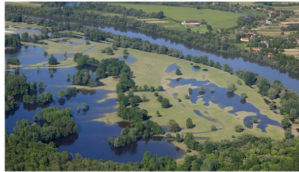
Save im Lonjsko Polje Naturpark.

Zur Ergänzung des Save Teams sucht das Koordinationsteam der „Rettet das Blaue Herz Europas“ Kampagne jemanden für die Koordination der Aktivitäten an der Save in Kroatien und flussabwärts (Bosnien & Herzegowina und Serbien). Hier zur Stellenausschreibung